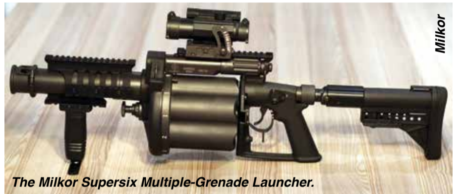
The Milkor Supersix Multiple-Grenade Launcher.