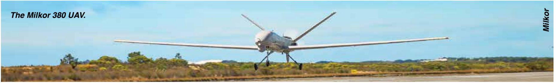
The Milkor 380 UAV.