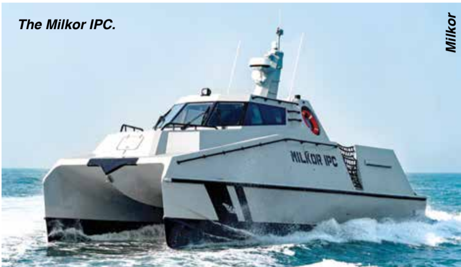
The Milkor IPC.