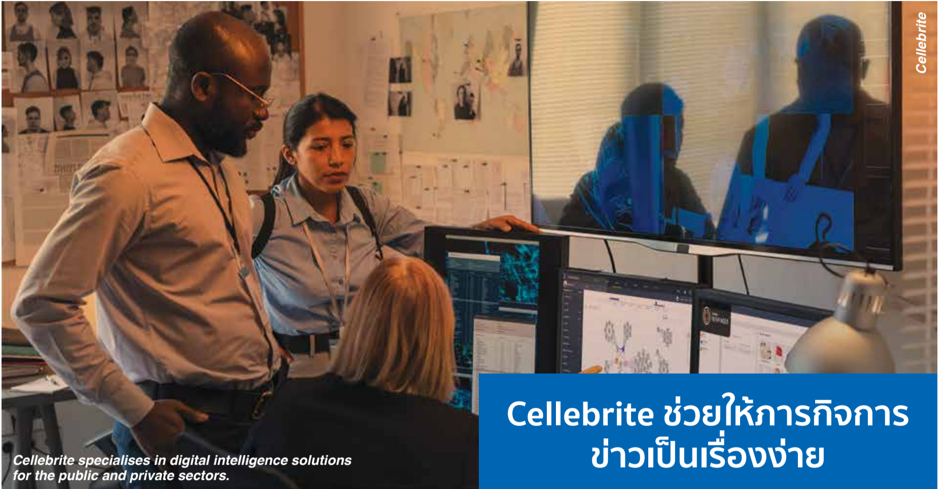
Cellebrite specialises in digital intelligence solutions for the public and private sectors.